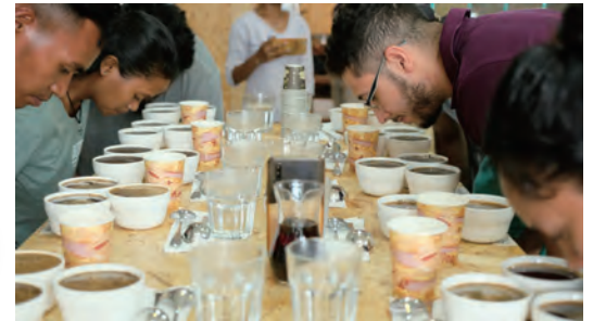
コーヒーフェスティバルでの カッピングの様子

東南アジアに位置する東ティモール。さんさんと降りそそぐ太陽、山から引いた新鮮な水、多様な日陰樹……豊富な自然の力と、農家一人ひとりの手作業によって、パルシクの有機フェアトレードコーヒーは作られています。今回の旅では、コーヒー産地で農家さんと交流するだけではなく、年に一度の東ティモール・コーヒーフェスティバルに参加し、コーヒーのカッピングやテイスティングを始めとした様々なイベントを楽しみます。