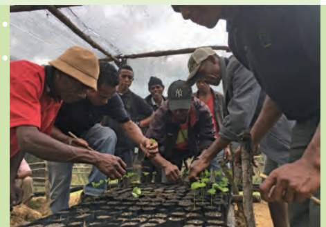
ココマウ組合のコーヒー畑改善 事業の一環で育苗の様子